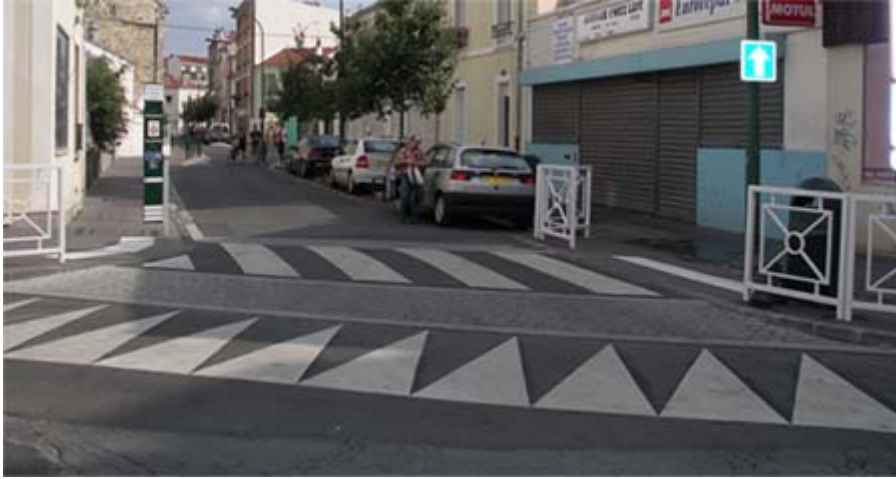
Vincennes passage piéton surélevé au niveau du trottoir.