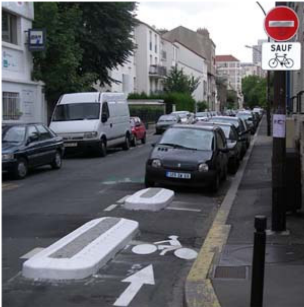
Montreuil : protection physique des cyclistes uniquement dans les zones à risque