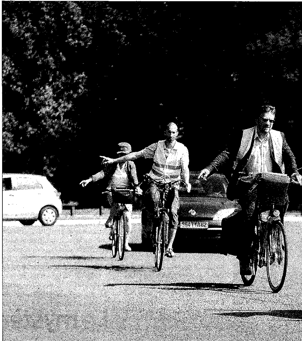
Les vélos sont de mieux en mieux accueillis dans l'agglomération. Le rond-point de l'uni-à-Pau, testé ici par les membres de Pau à vélo, reste un des points noirs.