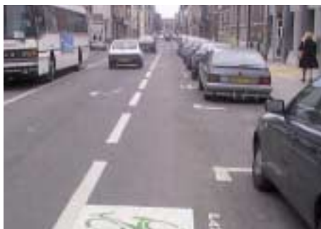
Ah ! Que c'est beau, une bande cyclable bien tracée ! En 1999, la bande de la rue Jean Lecanuet.