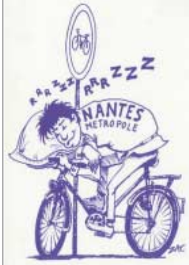
DR Place au vélo-Nantes

1000 cartes pour un vélo facile en ville