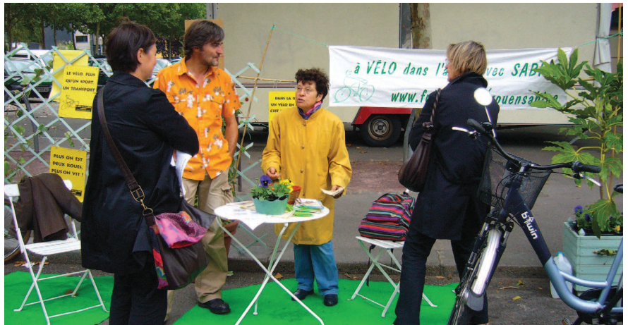
Le stand SABINE, installé de 11 h à 17 h au coin de la rue Armand Carrel et de la rue d'Amiens

On loue une place de parking et, à défaut d'y garer sa voiture, on en fait un lieu de vie et de rencontre. Pendant une journée, les espaces bétonnés deviennent ainsi des lieux d'initiatives engagées, originales, créatives et écologiques, pour imaginer de nouveaux usages de la ville de demain.