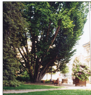
Le charme pyramidal du square Verdrel.