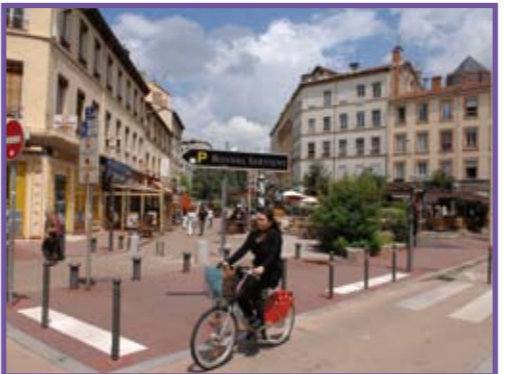
Vélo en libre-service

Instabilité juridique du projet : comme toutes les obligations qui incombent aux collectivités territoriales, le non respect des dispositions prévues par l'article L. 228-2 du code de l'environnement peut aboutir à l'annulation des délibérations approuvant le projet soit par la voie d'un déferé préfectoral soit à la demande d'un administré ou d'une association d'usagers cyclistes qui en ferait la demande. Plusieurs cas récents ont été jugés en ce sens.