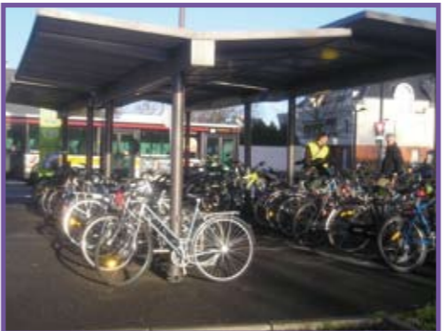
Véloparc à un point d'arrêt de transports collectifs

Au-delà du simple respect de leurs obligations légales, les collectivités en charge de l'aménagement de la voirie ont tout intérêt à mettre en place les dispositions de cet article afin de favoriser la sécurité des circulations, la mise en place progressive de réseaux cyclables urbains, le développement de l'usage des modes doux... Penser dès l'amont des projets aux aménagements cyclables, c'est une nouvelle manière de penser la ville et le partage de la voirie.